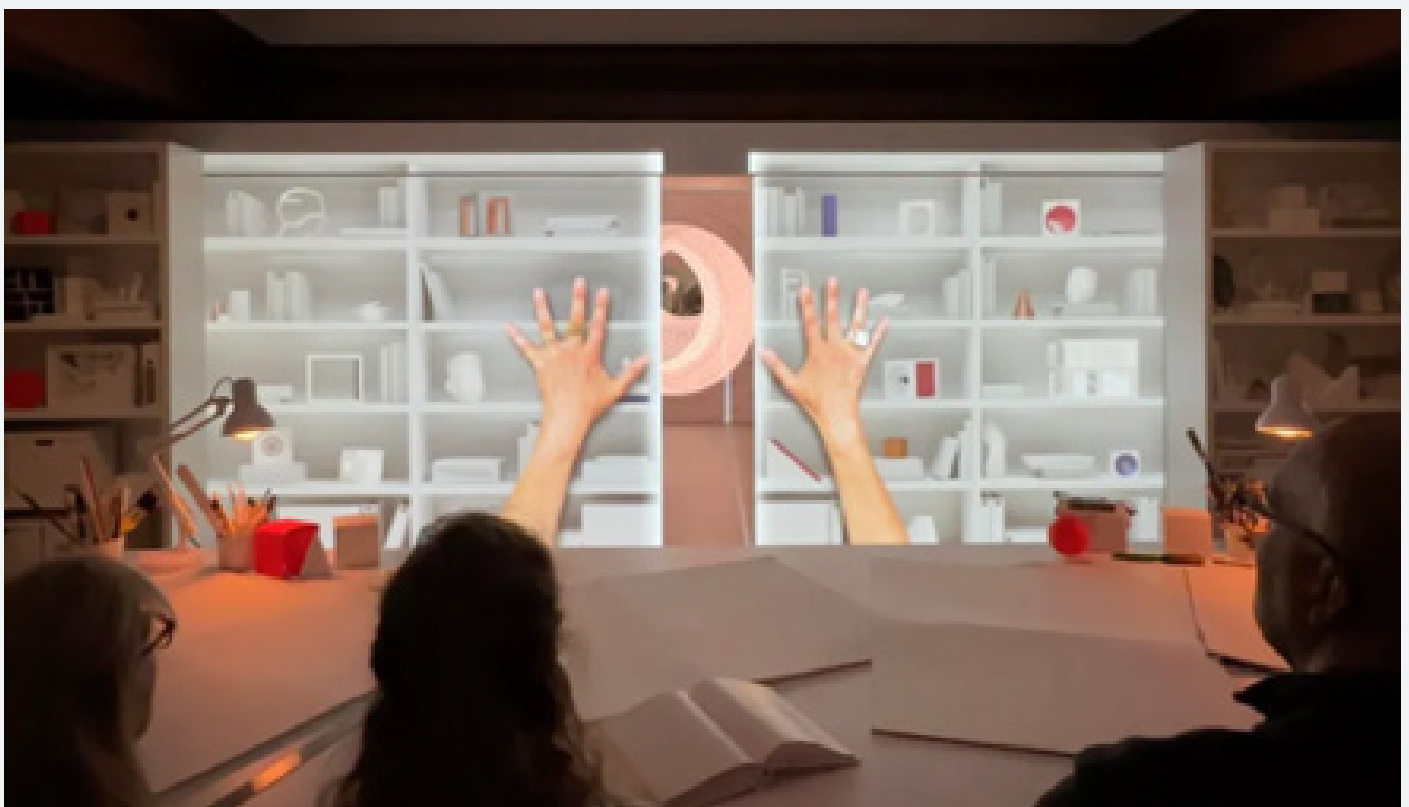
در ابتدای نمایشگاه، از بازدیدکنندگان با انیمیشن‌های پروژکت شده بر دیوار و ویدیویی که توسط دولین در استودیوی او ساخته شده پذیرایی می‌شود.

در این اتاق، استودیوی دولین بازسازی شده است. دیوارهای آن با نقاشی‌های نواری پوشیده شده است؛ قفسه‌های آن مملو از جعبه‌های پرورنده، کلاسورها و ماکت‌های مقوایی است. بر روی یک میز که در وسط اتاق قرار گرفته، مجموعه‌ای از کاغذهای سفید و لیوان‌های حاوی مداد و قلم مو دیده می‌شود. در عرض چند لحظه،