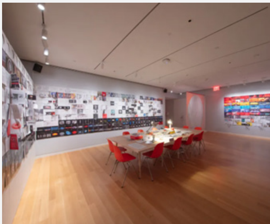
مسئول نمایشگاه می‌گوید:

انیمیشن‌های پروجکشن شده شروع به پخش بر صفحات سفید کرده و توهمی از موسیقی و متن را با حاشیه‌نویسی‌های مختلف ایجاد می‌کنند. این در حالی است که ویدیویی که توسط دولین روایت می‌شود بر یک دیوار پروجکت می‌شود.