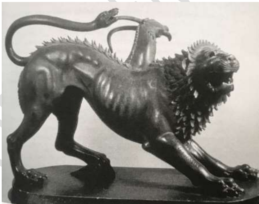
- کایمرای کلاسیک آرتزو، مشهورترین نمونه از اسطوره یونان کایمرای آرتزو. مجسمه‌ای برنزی با منشأ اتروسک (حدود قرن پنجم پیش از میلاد) که ارتفاع آن تقریباً ۸۰ سانتیمتر است. کشف شده در حوالی آرتزوی ایتالیا، ۱۵۵۳.