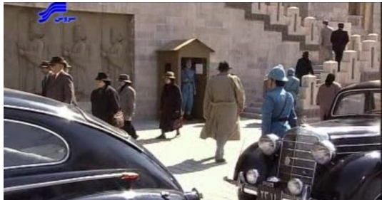
تصویر ۷. نمایی از محوطه‌ی مقابل ورودی اصلی ساختمان شهربانی

انتخاب دو لوکیشن داخلی و خارجی مجزا و ظاهراً بدون ارتباط با یکدیگر برای ساختمان شهربانی، اندیشه‌ی تعامل پلان و نما در ذهن طراح صحنه توانسته است انتخاب‌های درست و هماهنگی را برای وی به همراه بیاورد.