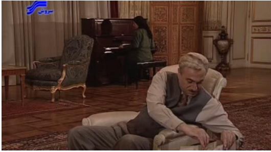
تصویر ۳. سالن پذیرایی خانه زینت‌الملوک