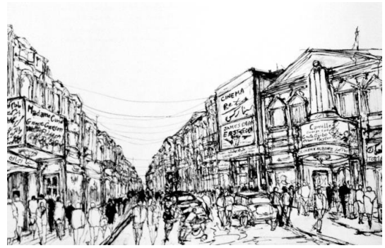
تصویر ۱. نمایی از خیابان لاله‌زار قدیم، اسکیس از خسرو خورشیدی، ۱۳۹۱ (خورشیدی، ۱۳۹۱: ۱۲۲)

مدار صفر درجه ، از صحنه‌های داخلی متعدد برخوردار است، به‌طوری که در نهایت و با ارزیابی دقیق می‌توان بیست‌وهفت صحنه داخلی را در این مجموعه شناسایی کرد. با این حال در این ارزیابی، هفت صحنه - به‌عنوان اصلی‌ترین لوکیشن‌های داخلی - بررسی می‌شود.