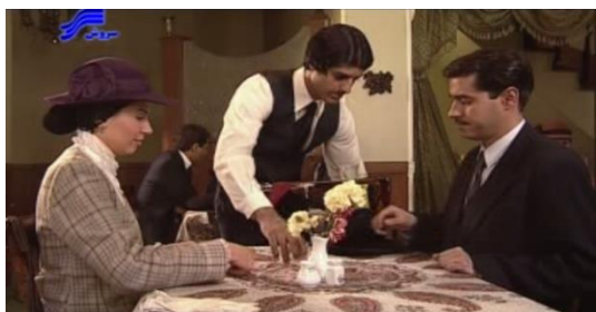
تصویر ۸. سالن اصلی گرند هتل

یکی از لوکیشن‌هایی که چندین بار در این مجموعه با زوایای مختلف به نمایش درآمده است، کافه رستوران گرند هتل - بازسازی‌شده‌ی آن در مجموعه‌ی "شهرک سینمایی غزالی" - است. این کافه که در واقع جزئی از مجموعه‌ی زیبا و باارزش خیابان لاله‌زار بوده است، تمامی ویژگی‌های خاص این خیابان را در خود جمع کرده است و به نمایش می‌گذارد (تصویر ۸).