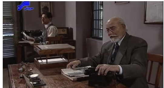
تصویر ۵. دفتر روزنامه حبیب

گذاشته می‌شود، ساختمانی است که دیوارهای داخلی آن خاکستری بوده و کف داخل آن نیز از موزاییک پوشانده شده است. در و پنجره‌های آن از چوب قهوه‌ای است و پنجره‌ها به‌صورت مشبک‌های بسیار ریز که مانع دید از بیرون می‌شود، ساخته شده است (تصویر ۵).