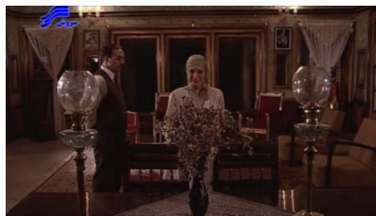
تصویر ۴. سالن پذیرایی خانه سعیده

چندین ستون برخوردار است. دیوارهای داخلی عمارت، از کاغذ دیواری‌های حاشیه‌دار پوشیده شده و کف آن با سنگ کرم‌رنگ فرش شده است. سقف بسیار بلند آن نیز با چوب‌هایی طرح‌دار پوشیده شده است. خصیصه بارز این عمارت، وجود در و پنجره‌های متعدد چوبی است که به صورت کشویی باز و بسته می‌شوند (تصویر ۴).