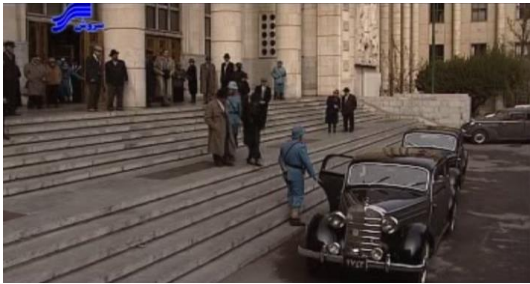
تصویر ۶. نمایی از مقابل ورودی اصلی کاخ دادگستری

عمدتاً آلمانی بودند- تغییرات، تزیینات و موتیف‌های سنتی ایرانی نیز به آن اضافه شد (تصویر ۶).