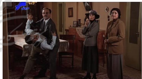
تصویر ۲. نمایی از اتاق ناهارخوری منزل پدری حبیب پارسا ۲

عمارت مربوط به شخصیت اصلی فیلم - خانه دکتر پارسا - عمارتی نسبتاً بزرگ با پلان شمالی و دارای حیاط است. نمای آن تمام آجری، همراه با در و پنجره‌های بلند چوبی است. فضای داخلی و رنگ دیوارها گرم و کف آن پوشیده از موزاییک است. در این خانه، علاوه بر نمادهای معماری دوره پهلوی همچون نمای تمام آجری، نشانه‌ها و عناصر معماری دوره قاجار نیز به چشم می‌خورند. با توجه به زمان اتفاق این مجموعه - دوره پهلوی اول -، وجود این عناصر در چنین صحنه‌ای بدیهی به نظر می‌رسد (تصویر ۲).