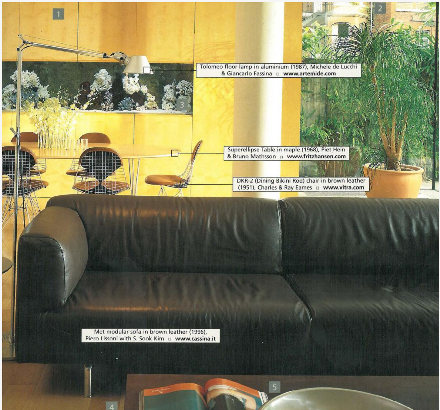
1 Tolomeo floor lamp in aluminium (1987), Michele de Lucchi & Giancarlo Fassina □ www.artemide.com

مالکان اجتماعی این خانه سبک ادواردین، شیفته برگزاری مهمانی و حتی لذت بردن از کنسرت‌های کوچک موسیقی در خانه‌شان هستند. معمار، به منظور